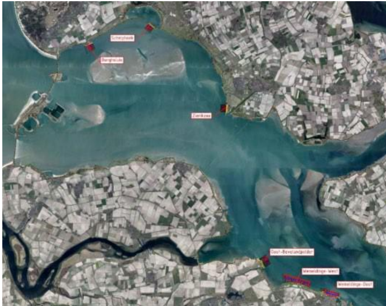
Overzicht locaties werkzaamheden